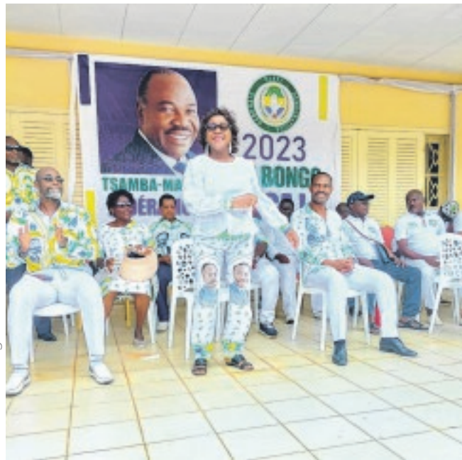
Les Pdgistes de Tsamba-Magotsi. ici au village Moulandou-Fouala.

Les fédérations Mboundou Ngouba, où était présente la camarade Lucie Milebou, et à la fédération "Nicolas-Guimeni", sous l'œil avisé du membre du comité permanent, Guy Bertrand Mapangou, n'étaient pas en reste de l'appel à candidature.